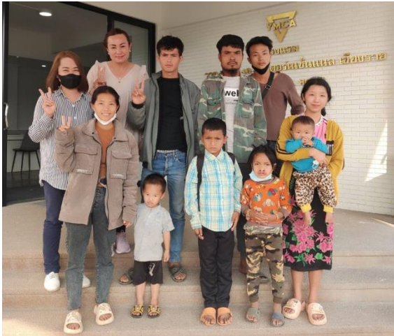
ผู้ป่วยลาวเดินทางมาผ่าตัด ช่วงเดือนกุมภาพันธ์

การผ่าตัดแก้ไขภาวะปากแหว่งเพดานโหว่ ระหว่างเดือนมกราคม - เมษายน 2566 ได้ผ่าตัดผู้ป่วย 15 คน (พม่า 6 ราย, ลาว 9 ราย) เป็นการผ่าตัดปากแหว่ง 11 ราย ผ่าตัดเพดานโหว่ 3 รายและ ผ่าตัดแก้ไขปากแหว่งซ้ำ 1 ราย